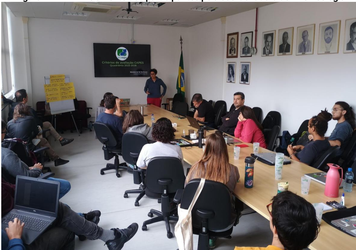
Figura 3 Nivelamento dos participantes por membro da Comissão