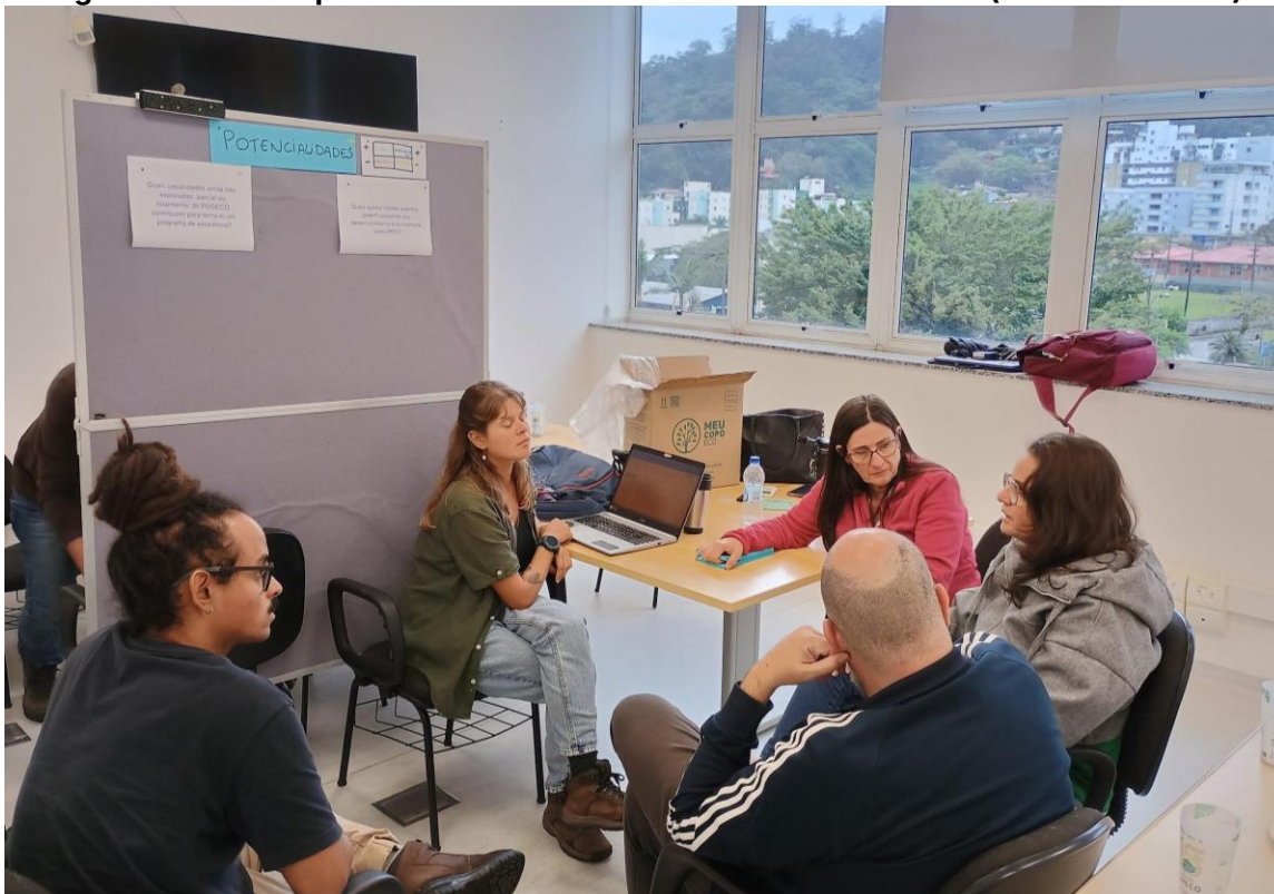
Figura 8 Grupo de Trabalho de análise situacional do PPEG (Obstáculos)