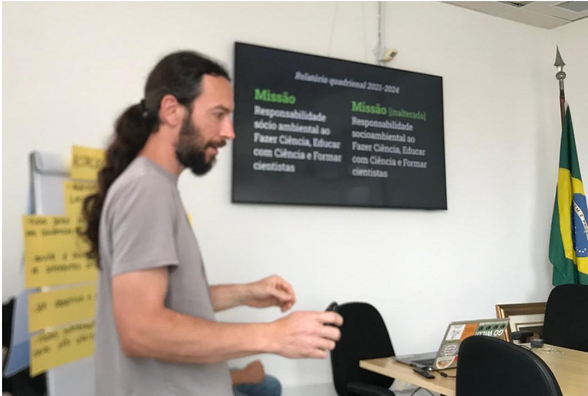
Figura 4 Participantes da Oficina